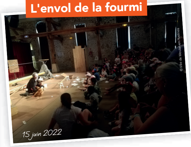
15 juin 2022