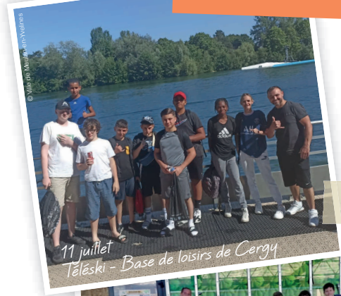
11 juillet Téleski - Base de loisirs de Cergy