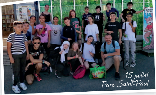
15 juillet Parc Saint-Paul