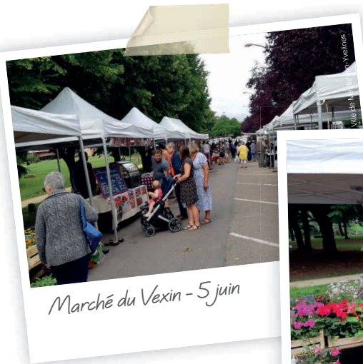
Marché du Vexin - 5 juin