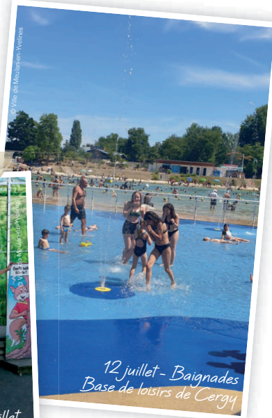
12 juillet - Baignades Base de loisirs de Cergy