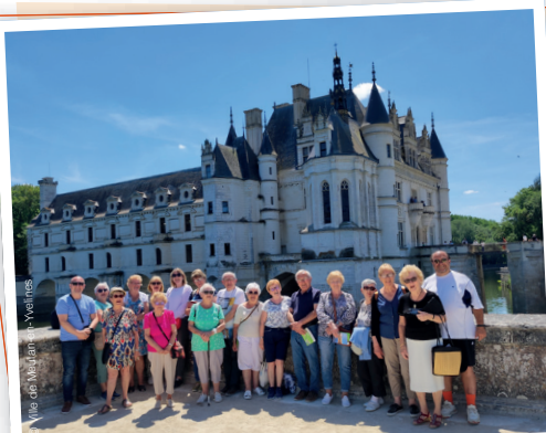
Séjour autour des châteaux de la Loire du 30 mai au 3 juin 2022 : Amboise, Chenonceau et Azay-le-Rideau puis centre historique de Tours avec ses maisons à colombages.

Journée à Amiens le jeudi 16 juin 2022 Visite des incontournables de la ville (cathédrale gothique classée au patrimoine mondial de l'Unesco) et découverte en barques traditionnelles des hortillonnages, également appelés la Venise Verte du Nord.