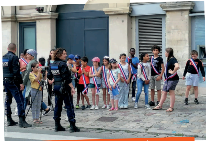
Mercredi 22 juin, le Conseil municipal des enfants a été reçu par la police municipale. Au programme : visite du poste de police, brief sur le métier d'agent et sensibilisation sur la prévention routière... avec l'utilisation d'un radar !