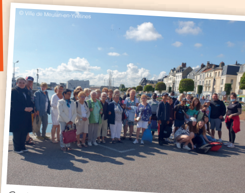
Sortie à la mer à Dieppe le mardi 5 juillet 2022. Promenade pour les seniors et les jeunes dans la station balnéaire qui offre un front de mer qui s'étire sur 1500 mètres.