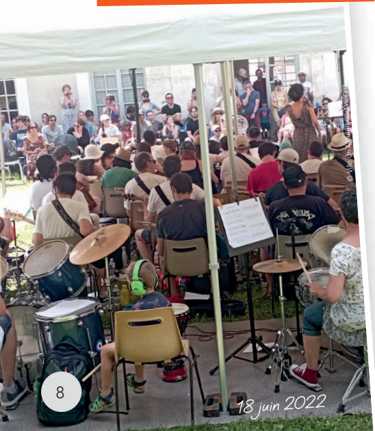
18 juin 2022