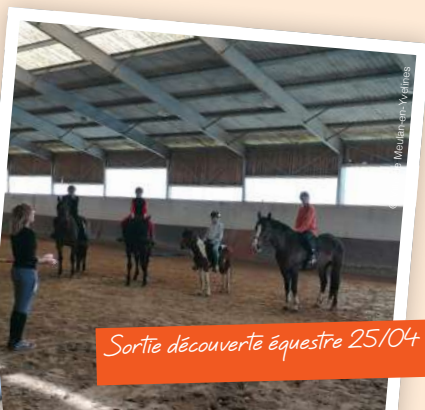
Sortie découverte équestre 25/04