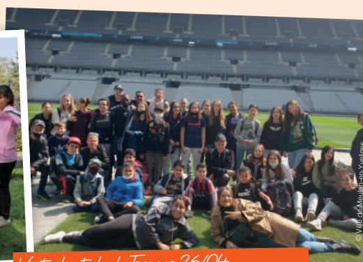
Visite du stade de France 26/04