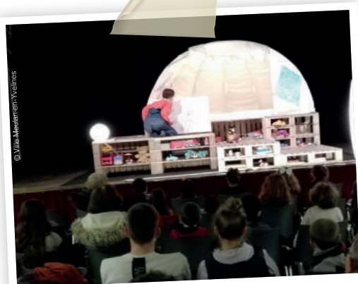
23 février. "Depuis que je suis né". Un spectacle jeune public dans le cadre d'Odyssees en Yvelines. Les enfants n'ont pas perdu une miette de l'histoire extraordinaire d'un petit garçon de 6 ans qui se lance dans l'écriture de ses mémoires !