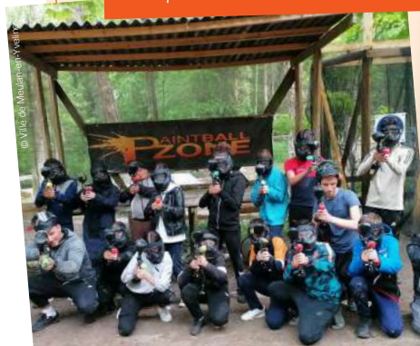
Sortie paintball 28/04