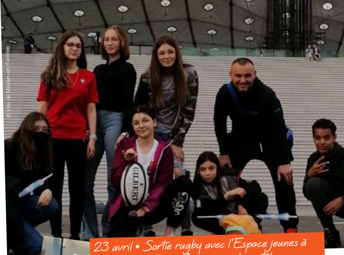
23 avril • Sortie rugby avec l'Espace jeunes à Paris La Défense Arena pour le match Racing 92 - Biarritz