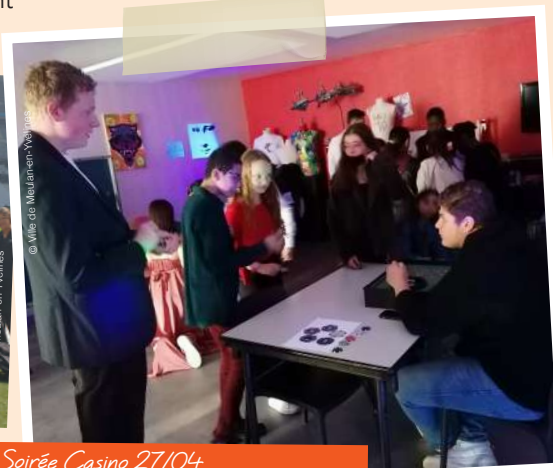
Soirée Casino 27/04