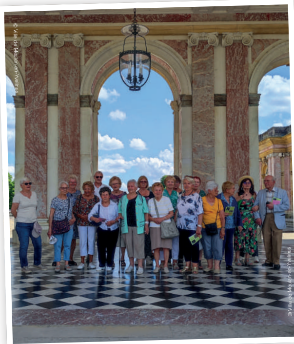
Sortie seniors : visite du domaine de Trianon, le 17 mai