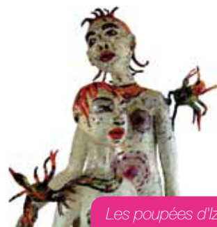
Les poupées d'Iziak