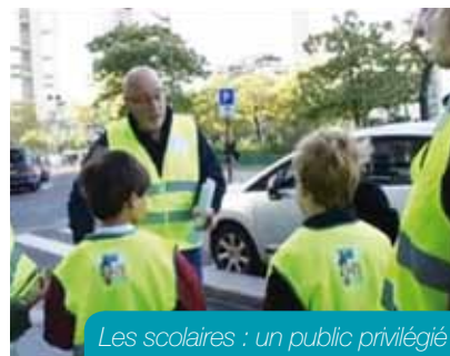
Les scolaires : un public privilégié

La prévention routière intervient dans les écoles, auprès des étudiants, des seniors ou du grand public lors de manifestations organisées par les collectivités. Le Comité des Yvelines recherche des bénévoles pour développer ses actions, en particulier dans les écoles primaires.