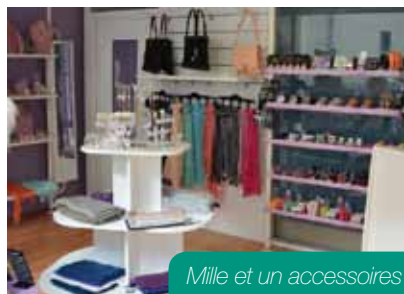
Mille et un accessoires

Véronique vous propose des bijoux fantaisie, plaqués or et argent, des accessoires de mode, des cosmétiques et textiles de saisons. De quoi faire le plein de bonnets ou écharpes pour l'hiver.