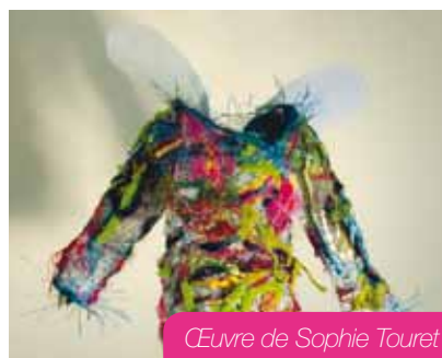
Œuvre de Sophie Touret